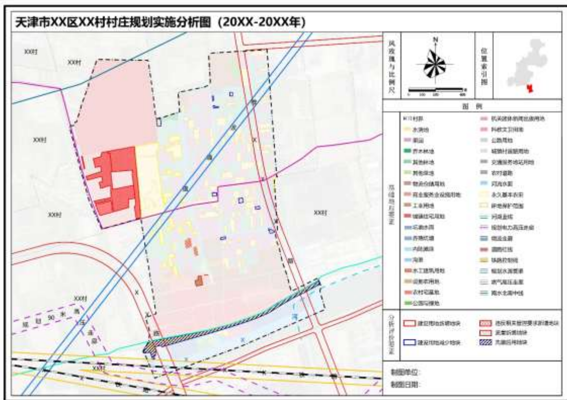
图 F.1 XX 村城乡建设用地变化“一张图” 15